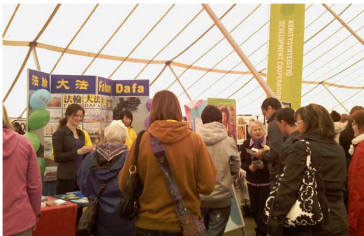
图：世界村活动中人们围在法轮功展台前了解真相

各国政要代表当地民众发出褒奖，传达的是民众的呼声，而这种呼声的基础自然是事实与公义。那就是，亿万人的修炼实践证明，法轮大法是大法大道，在把真正修炼的人带到高层次的同时，对稳定社会、提高人们的身体素质和道德水准，也起到了不可估量的正面作用。法轮大法的真、善、忍原则为人类铺就了一条返本归真的永恒之路，在连宵风雨中，法轮功已弘传世界一百多个国家和地区，这彰显着大法的威德，也预示着光明的未来。◇