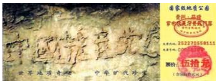
贵州省平塘县掌布乡风景区门票