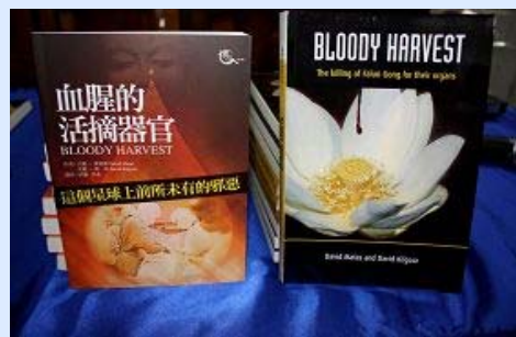
《血腥的活摘器官》中文版和英文版

左图：大卫·麦塔斯是著名人权律师，曾在二零零七年获得加拿大律师协会颁发的年度人权奖，二零零八年一月获得了加拿大马尼托巴省律师协会颁发的二零零八年杰出服务奖，二零零八年十二月三十日，获加拿大总督颁发的平民最高荣誉——加拿大勋章（Order of Canada）。