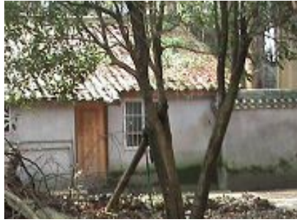
彭州市桂花镇三圣寺洗脑班在 寺庙右边大门内前行五米左转 小木门内

2011年6月22日下午6时左右，周玉松去接孙儿时被蒙阳镇“610”伙同（竹瓦乡原1大队和7大队的人）书记曾纪奎，村长向贤生把周绑架到彭州市桂花镇三圣寺洗脑班。家里后来才知他被绑架。参与绑架还有刘正芳，李小牛，小戴，小联。电话 13568951800