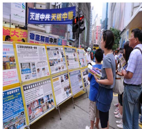
图: 在香港维多利亚公园附近的真相展板点, 许多大陆游客手拿着《九评共产党》书、法轮功真相资料驻足认真观看真相展板上的法轮功真相。