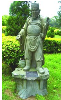
图：二十四孝之“亲涤溺器”，讲的就是黄庭坚的故事。