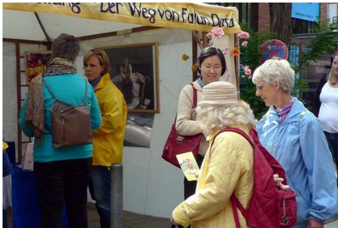
法轮功学员参加德国阿尔托纳文化节