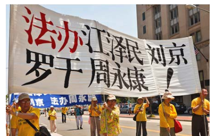
图: 二零一零年七月二十三日, 法轮功学员在美国华盛顿举行反迫害大游行。

美国国会在 2010 年 3 月 16 日, 以 412 票赞成、1 票反对, 通过了第 605 号决议案, 要求中共立即结束对法轮功学员的迫害、监禁、酷刑及释放所有被关押的学员, 并敦请美国总统及国会议员关注法轮功学员被迫害事件。◇