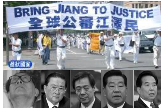
西班牙法庭以群体灭绝罪起诉江泽民

在过去十二年的时间里，即使遭受残酷的迫害，广大法轮功学员仍然坚持对“真、善、忍”的信仰，向民众讲