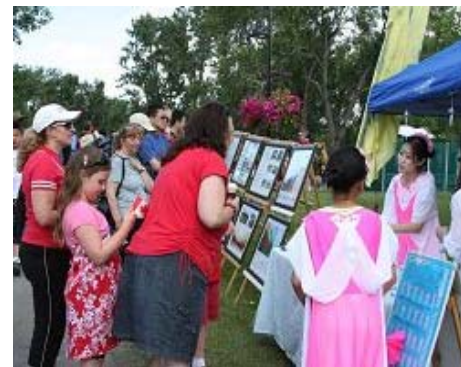
法轮功展位前人潮不断

一位中年印度男子，在看完了展板后，和展台前的学员认真地说：“我想和你说，我对法轮功表示支持！”他还和学员谈论中共为什么要迫害法轮功。学员告诉他，因为法轮功非常受欢迎，而且法轮功有信仰，中共最害怕有信仰的人，人们有信仰就使这个执政党感到没有安全感。没等说完，他连连点头，说：“我懂我懂，所以它也迫害天主教徒、西藏人等等，只要是思想的，它（中共）什么都迫害。”◇