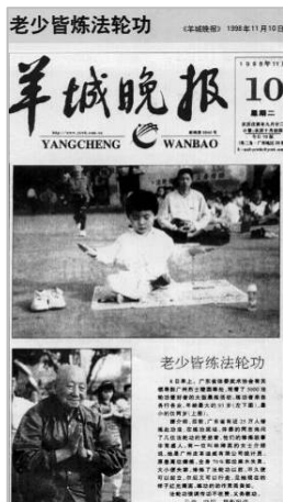
下图/1994年7月李洪志先生在大连的第二期法轮功传授班。右图/1998年11月10日《羊城晚报》头版报道——“老少皆炼法轮功”。

● 法轮功教人向善 法轮功也称法轮大法，是1992年由李洪志先生在中国开始弘传的一门佛家上乘修炼大法，以“真、善、忍”为根本指导，包括五套缓慢优美的功法动作。法轮功要求修炼人从做好人做起，不断地提高道德水准，对稳定社会，提高精神文明起到了不可估量的正面作用。