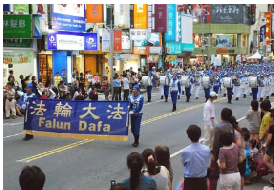
天国乐团踩街所到之处万人空巷

（明慧记者王清汉台湾嘉义报道）二零一一年七月二日的黄昏，台湾法轮大法天国乐团盛大的队伍进入“世界管乐年会”大会开幕仪式的嘉义市体育场，经过司令台前时赢得全场热烈欢呼及掌声。在演奏的雄壮军乐中，司仪高呼着欢迎天国乐团进场，并特别介绍说：“法轮功为社会带来身心的健康。”