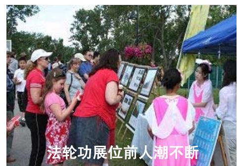
法轮功展位前人潮不断

卡尔加里法轮大法学会每年都参加王子岛一年一度的加拿大日庆祝, 从人们热情的反馈看, 人们都在迫切地想了解法轮大法。