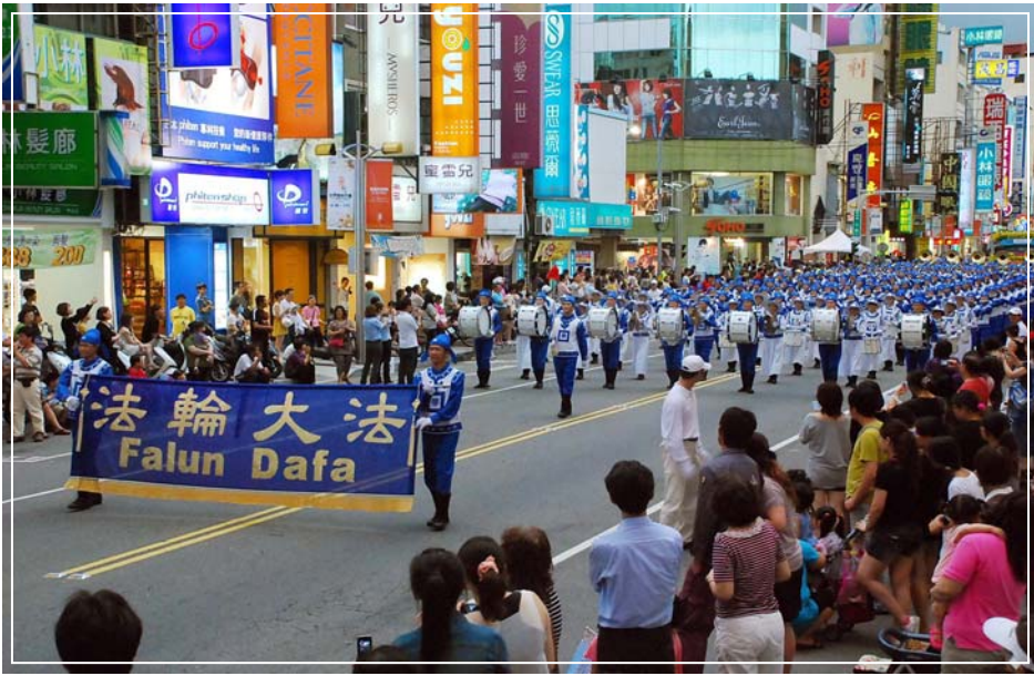
天国乐团庞大阵容为嘉义市民首见，天国乐团踩街所到之处万人空巷