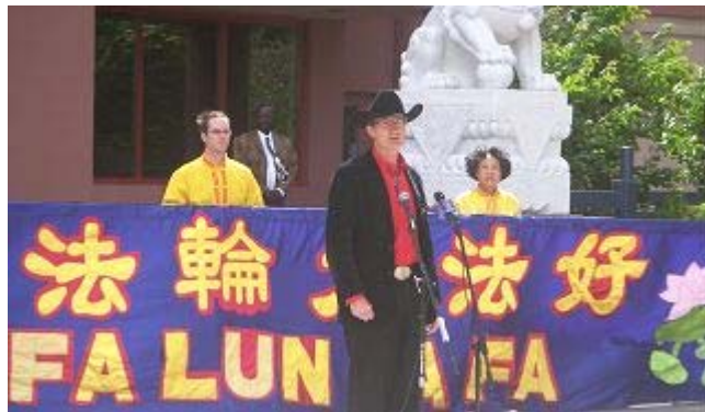
加拿大亚省议员戴维·斯旺在集会上发言

他认为每个人都应该享有基本的人权，当中共不给人们这些权利时，作为加拿大人，作为世界的一部份，必须也有责任站出来，为保证所有的人拥有这样的权利而战斗。他认为法轮功在做这样的工作，他对此表示钦佩和敬重。他期望人们享有言论自由、宗教信仰自由和集会自由，并祈祷法轮大法万岁。