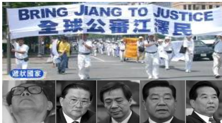
西班牙法庭以群体灭绝罪起诉江泽民

不管江泽民或中共出于什么目的放出这种信息，这种自认“镇压法轮功是蠢事”的说法，对那些还在继续参与迫害法轮功的人和那些上当受骗或仇恨法轮功的人们，是值得去深思和反省的，跟着中共一条路走到黑，只能是自己害自己。◇