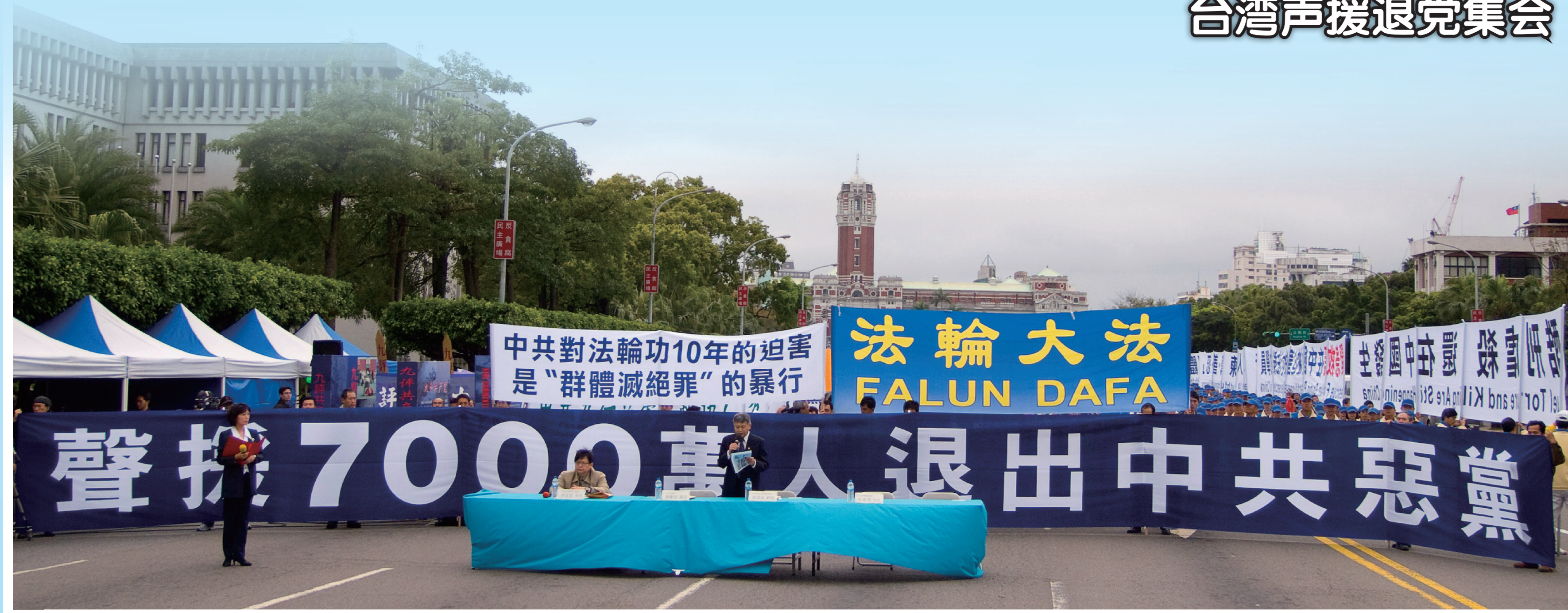
台湾声援退党集会