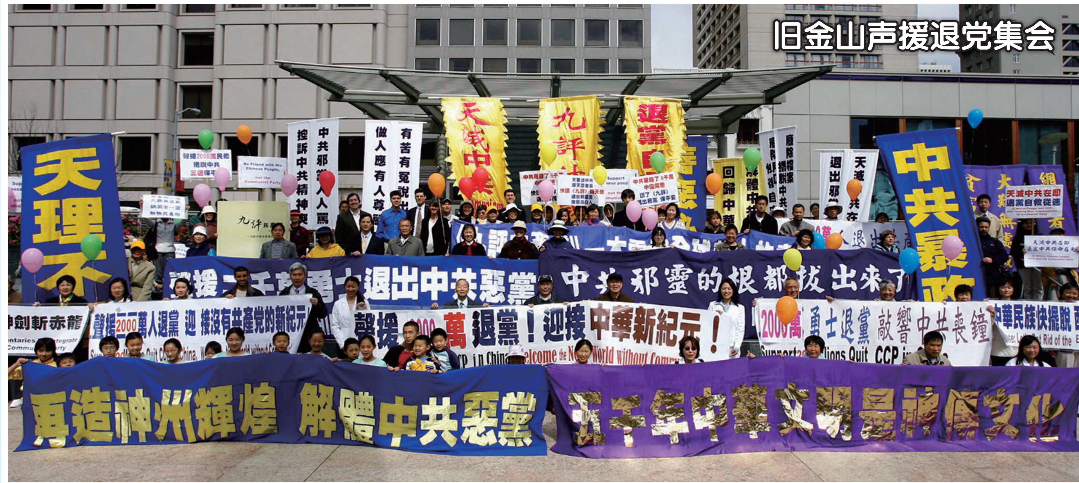
旧金山声援退党集会

中共犯下滔天大罪，中共的本质是西来幽灵——共产邪灵附体的邪教组织。《共产党宣言》开篇就说：“一个幽灵，共产主义的幽灵，在欧洲游荡。”因为共产党是魔鬼幽灵，那么在加入其党、团、队时宣誓对其效忠，就是向魔鬼幽灵宣誓效忠；誓为其党奉献终身，就是把生命交给魔鬼幽灵，成为它的奴隶和工具。这样的誓言是一个卖身契，是一个毒誓，发毒誓时，就会被邪灵在右手和额头上打上印记。世界上这种举着右手发毒誓的“宣誓仪式”唯共产党独有，而将来天灭中共之时，没有抹去印记的人就会成为陪葬。