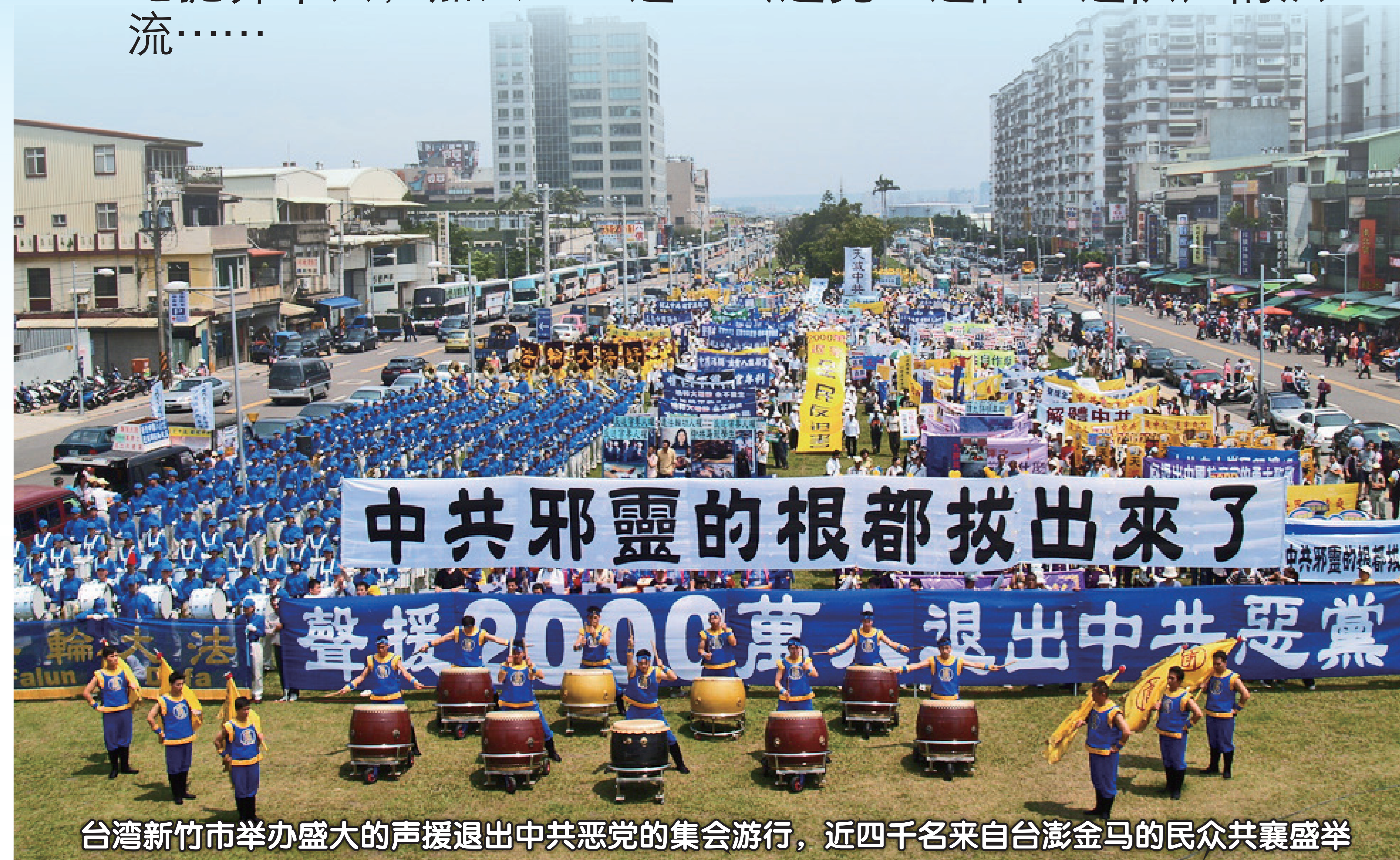
台湾新竹市举办盛大的声援退出中共恶党的集会游行，近四千名来自台澎金马的民众共襄盛举