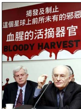
图：六月二十八日，大卫·麦塔斯和大卫·乔高在发布会上。