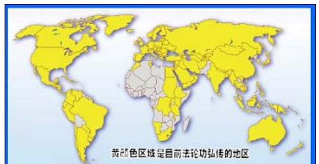
图：黄颜色区域是目前法轮功弘传的地区

一九九六年十月十二日，休斯顿市市长罗伯特·雷尼尔宣布当日为休斯顿市“李洪志日”。罗伯特·雷尼尔说：“法轮大法超越了文化和种族的界限，让宇宙真理响彻地球的每一个角落，并在东西方差异间架起桥梁。李洪志先生不知疲倦地将法轮大法从中国弘传至世界各地，沿着这条道路，他影响了许多国家难以计数的人的生活，赢得了崇高的国际声誉。”