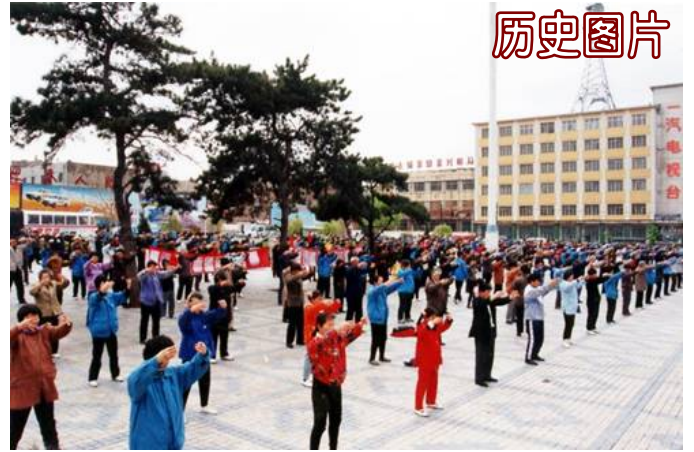
图为 1999 年以前，吉林省长春市第一汽车制造厂炼功点集体炼功场面

我们夫妻交流后没有参与要房。和我差不多时间入厂的同事都在积极地找领导摆条件，因房子少，直闹矛盾，最后大多住进了一居室的单元房，分房基本结束了。领导