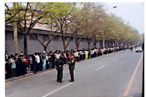
图：1999年4月25日，上万法轮功学员和平上访，向当局反映法轮功的真实情况和刚刚发生在天津的公安暴力抓捕法轮功学员事件。整个上访过程秩序井然。离开后地上无一片纸屑，连警察扔的烟头都被他们清扫干净了。有警察感慨地说：“看，这就是德！”