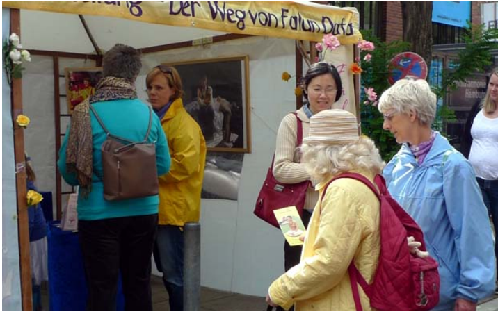
法轮功学员参加德国阿尔托纳文化节