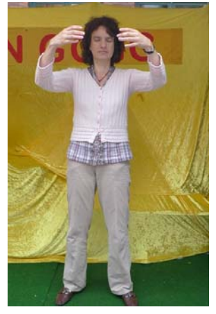
佩特拉展示第二套功法