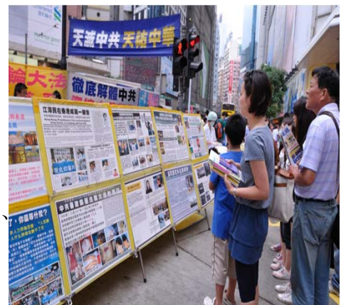
图：在香港维多利亚公园附近的真相展板点，许多大陆游客手拿着《九评共产党》书、法轮功真相资料驻足认真观看真相展板上的法轮功真相。

截至 2011 年 7 月 3 日止，已有超过 9795 万中国民众在海外大纪元网站声明退出中共党、团、队。天灭中共邪教，退党团队“三退”保命。