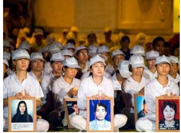
台湾法轮功学员于七月十七日晚间在自由广场举行烛光悼念会，悼念为坚持信仰“真善忍”真理而遭受中共迫害致死的法轮功修炼者