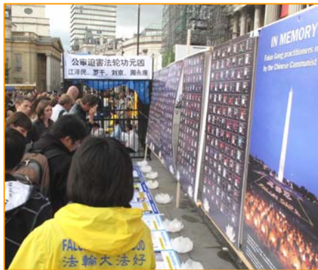
图：2011年7月16日，英国伦敦鸽子广场，人们被法轮功真相吸引。

亲身受益的法轮功学员自然希望更多的人也能象他们一样受益。他们在修炼前，面临的困扰其实也是现代社会的人们普遍面对的问题。金钱买不来健康，地位也带不来幸福感和安全感，相反，一味追求金钱和地位，一味的追求物质和感官上的满足，却