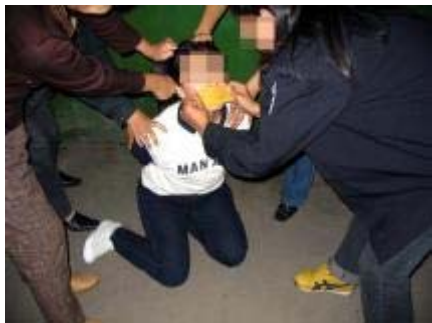
图:酷刑演示:用胶带封嘴

二零零五年一月,她被非法劳教两年(保外就医一年),安徽省女子劳教所狱警因她坚持对真善忍的信