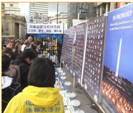
图：2011 年 7 月 16 日，英国伦敦鸽子广场，人们被法轮功真相吸引。

亲身受益的法轮功学员自然希望更多的人也能象他们一样受益。他们在修炼前，面临的困扰其实也是现代社会的人们普遍面对的问题。金钱买不来健康，地位也带不来幸福感和安全感，相反，一味追求金钱和地位，一味的追求物质和感官上的满足，却