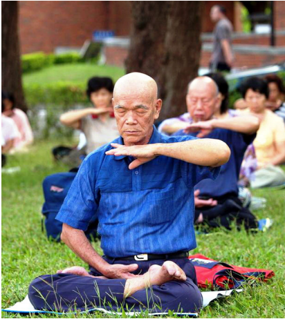
目前，法轮功已弘传世界100多个国家和地区，修者上亿人。图：台湾法轮功学员炼功。

炼法轮功可以祛病健身，但不是用来治病的。法轮功是佛家修炼大法，要求修炼者提高心性，随着思