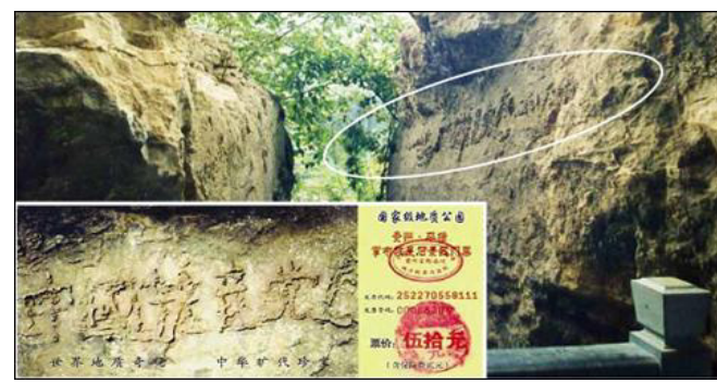
图为“藏字石”照片，小图为风景区门票。

江泽民损害的是手无寸铁、受欺挨压的老百姓。善良的人为什么要把自己比作独裁者呢？况且，国家政权在人类社会的存在，必须是以人性和公理为第一原则，必须是以服务和保护国民为根本目的。 香港《前哨》杂志 2011 年 2 月的头条文章中，作者严大明揭示了江泽民的自白，文章题目是《江泽民终生后悔的两大事件》。江泽民都自认“镇压法轮功是蠢事”。不过悔已晚矣，那么多人的生命岂是后悔就可了结的，何况迫害至今还在继续。