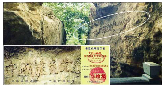
图为“藏字石”照片，小图为风景区门票。

江泽民损害的是手无寸铁、受欺挨压的老百姓。善良的人为什么要把自己比作独裁者呢？况且，国家政权在人类社会的存在，必须是以人性和公理为第一原则，必须是以服务和保护国民为根本目的。 香港《前哨》杂志 2011 年 2 月的头条文章中，作者严大明揭示了江泽民的自白，文章题目是《江泽民终生后悔的两大事件》。江泽民都自认“镇压法轮功是蠢事”。不过悔已晚矣，那么多人的生命岂是后悔就可了结的，何况迫害至今还在继续。