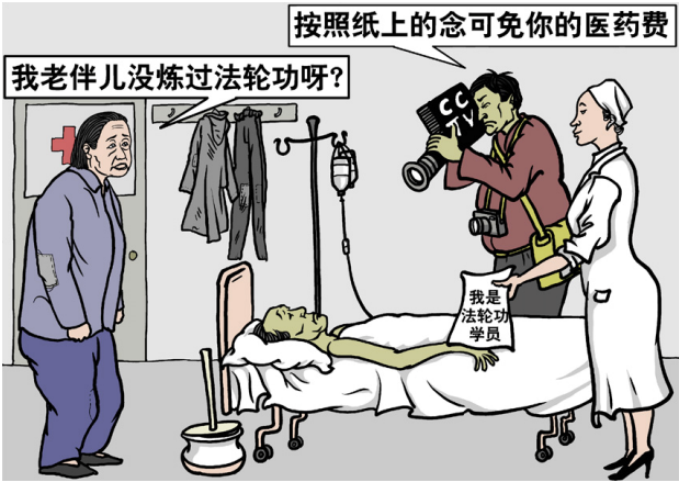
(4) 被迫害致死，也要收入“1400”例

了？他又惊又喜，对亲友及病房的人讲：“是不是法轮功的师父管我了？！”第二天，他对医生说他的病好了，医生不信，说不可能，再观察几天。几天过去了，老人的病真的好起来了，医生只好让他出院了。据悉，医院中有其他个别病人也遇到类似情况，但他们同意记者以自己为例做报导或作出统计数据上报，说自己是练法轮功得的病，交换条件就是报销医药费，可是出院后，当他们再找有关的派出所，竟无人承认有报销一事。