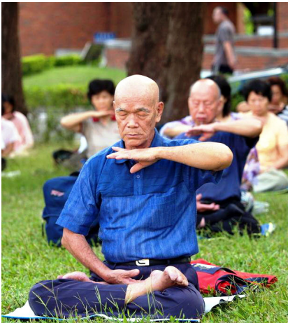
目前，法轮功已弘传世界100多个国家和地区，修者上亿人。图：台湾法轮功学员炼功。

炼法轮功可以祛病健身，但不是用来治病的。法轮功是佛家修炼大法，要求修炼者提高心性，随着思