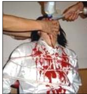
图左：中共酷刑——灌盐（演示图）

2005 年 9 月 5 日中午，汪礼迪在送孩子去上学的路上，被派出所朱所长（男）带的一车警察绑架（后来得知，他家楼下早就有一辆小轿车在监视着