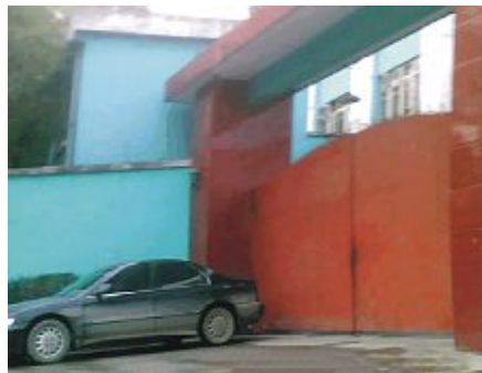
新津洗脑班现在的大门