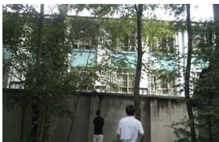
家属和亲友在洗脑班墙外呼喊亲人的名字