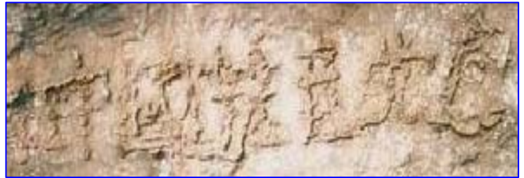
■贵州平塘县掌布乡桃坡村掌布河谷发现了有2.7亿年的“藏字石”，巨石断面内惊现六个大字“中国共产党亡”

圣经《启示录》中记载，凡在右手上或是在额上被红色恶龙打上了兽的印记的人，都要喝上帝愤怒的酒，在地狱里的烈火中永远被烧烤。现在在修炼界，很多人都知道中共恶党在另外空间的显象就是红色恶龙，（它们最喜欢用的颜色都是血红色，而且从历次政治运动中杀戮善良百姓及迫