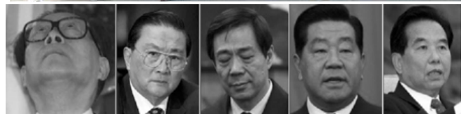
西班牙法庭以群体灭绝罪起诉江泽民

地区，受到各界的褒奖和赞誉。而江××及其同伙则被法轮功学员以“群体灭绝罪”、“反人类罪”、“酷刑罪”等罪名在多个国家起诉。