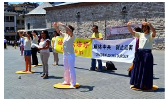
学员在伊斯坦布尔市中心举行反迫害活动

很多人在了解中共对法轮功的残酷迫害后，都感到极大的震惊和愤慨，人们纷纷谴责中共的血腥罪行以及对法轮功长达十二年的人权迫害。◇