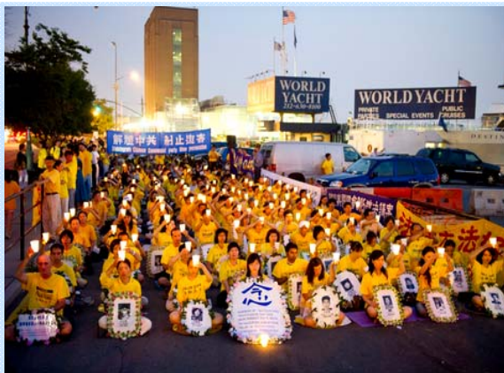
法轮功学员在纽约中领馆前举行烛光夜悼