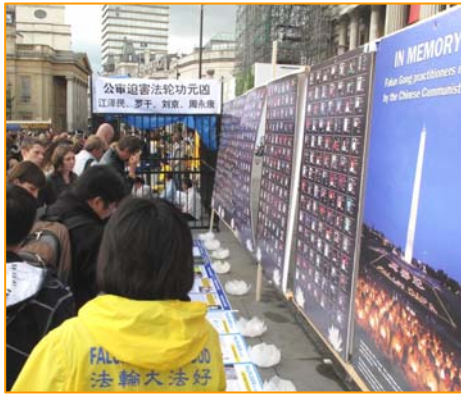
图：2011 年 7 月 16 日，英国伦敦鸽子广场，人们被法轮功真相吸引。

亲身受益的法轮功学员自然希望更多的人也能象他们一样受益。他们在修炼前，面临的困扰其实也是现代社会的人们普遍面对的问题。金钱买不来健康，地位也带不来幸福感和安全感，相反，一味追求金钱和地位，一味的追求物质和感官上的满足，却