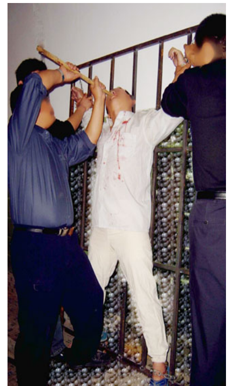
酷刑演示：撬嘴灌食