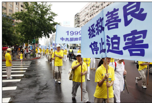
图：台湾法轮大法学会 7 月 17 日在台北举行悼念“7.20”活动——“拯救善良 停止迫害”大游行。

员，如果看到有人抓捕法轮功学员，您可以上前去围观，如果胆子大一点可以站出来，您可以大声地说上一两句公道话。