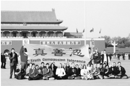
西人法轮功学员天安门前请愿

“真、善、忍”的横幅，盘腿立掌时，他抢拍了这一珍贵的历史时刻，并机智迅速地携带着胶卷安全