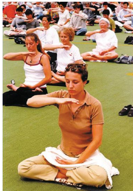
图：欧洲法轮功学员在打坐

法轮功的第五套功法是在打坐中进行。很多从前患有心脏疾病的人，通过修炼法轮功都获得了健康。但是法轮功并不是一般的静坐或气功锻炼，其效果更非一般的静坐可以相比。想了解更多了解法轮功的朋友可通读《转法轮》等著作。（文／华云）◇