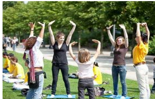
图上/台湾桃园中正国际机场大厅“欢迎陆客来台观光”的真相展板。