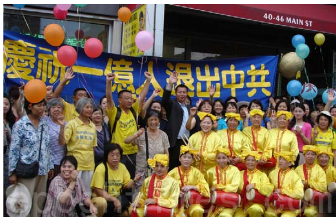
全球退党服务中心在纽约举办活动，庆祝一亿中国人三退（退出中共邪党、团、队）。