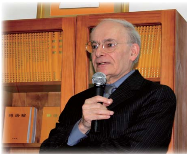
■著名人权律师大卫·麦塔斯

麦塔斯表示，他和大卫·乔高几年来致力于调查和揭露中共血腥活摘法轮功学员器官之事，这是一件非常艰巨的工作，因为没有任何直接的人证和物证——受害者的尸体最后都被焚烧了，而摘取器官是在暗地里进行的。尽管该调查工程浩大，工作艰苦，但确实是有价值的。他说：