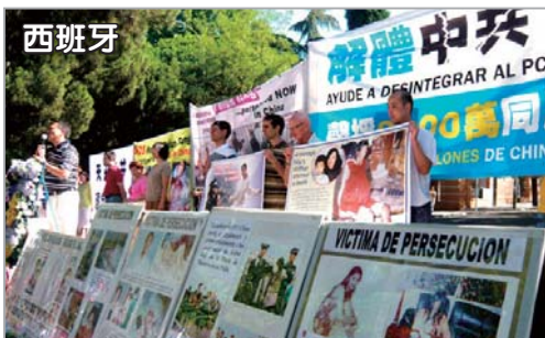
西班牙法轮功学员中使馆前抗议