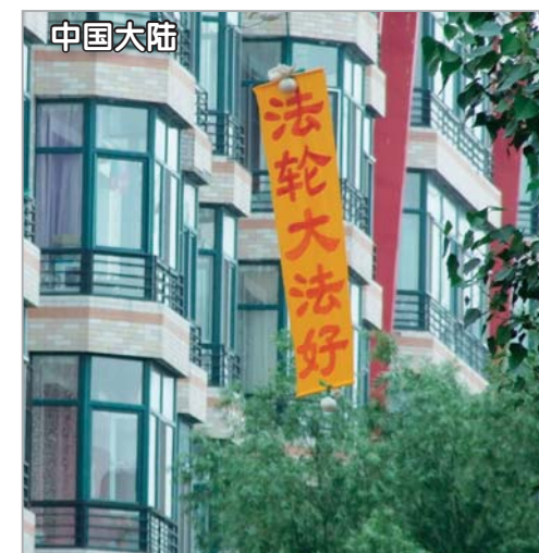
大陆某地树上飘拂的“法轮大法好”条幅