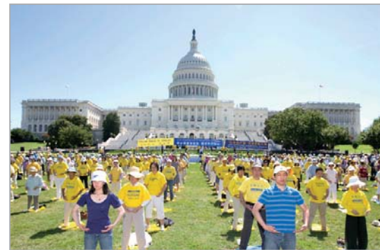
法轮功学员美国华府集会反迫害

“真、善、忍”的法则，以大善大忍的胸怀重塑着人类道德的丰碑，赢得了世界上关注正义与良知的人士的支持与尊敬，也让人们看清了中共的邪恶本质。