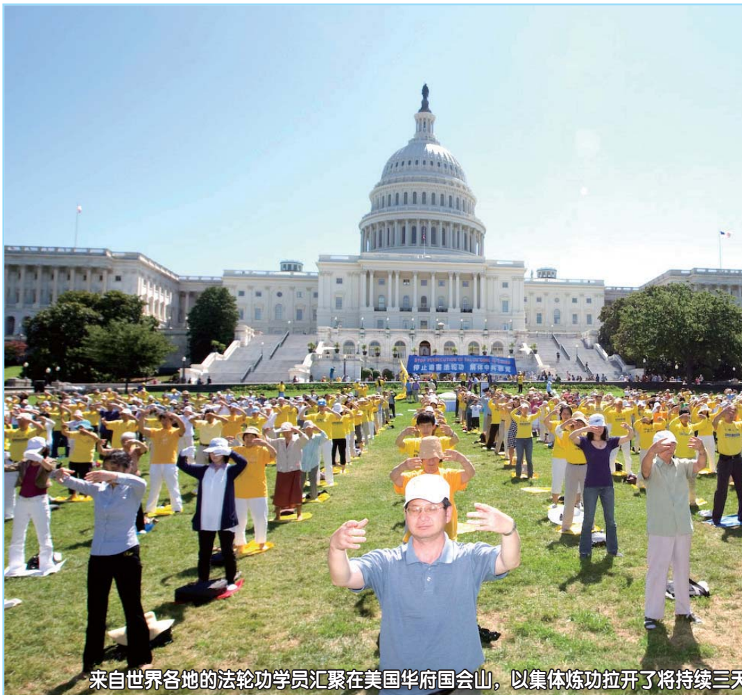
来自世界各地的法轮功学员汇聚在美国华府国会山，以集体炼功拉开了将持续三天

2011年7月14日，美国首都华盛顿的国会山庄再次响起“停止迫害”的强大呼声，来自世界各地的法轮功学员在此举行大型反迫害集会。美国多位国会议员，非政府机构、大赦国际、人权组织的代表纷纷到场表示声援。