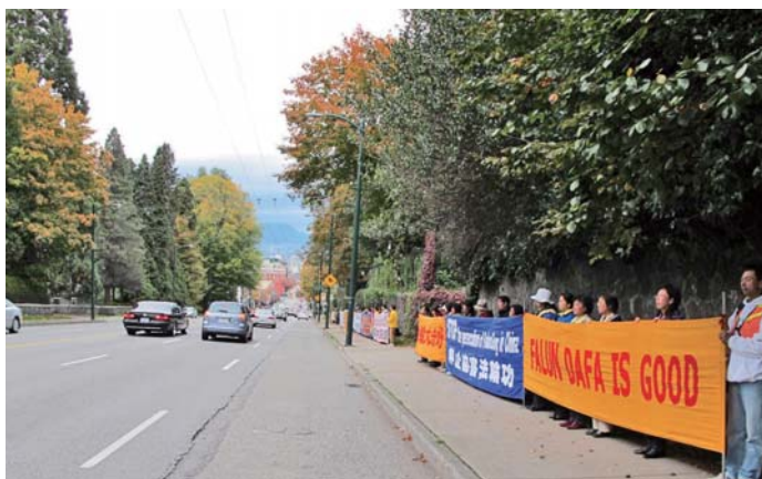
■ 法轮功学员在温哥华中领馆前抗议迫害

温哥华法轮功学员从2001年8月开始，每天在中领馆前进行24小时的抗议活动，要求停止迫害法轮功。2006年6月8日，当时的温哥华市长苏利文屈从于中共领事馆的压力，宣布法轮功的抗议展板等没有市政府的书面许可，违反了城市附例，向法庭申请拆除。法轮功学员的上诉律师奥维在法庭上论证：苏利文宣布取消法轮功学员在中领馆前的抗议展板与中领馆有关。另一位律师安世立也表示，苏利文是屈从于中共领事馆的压力。