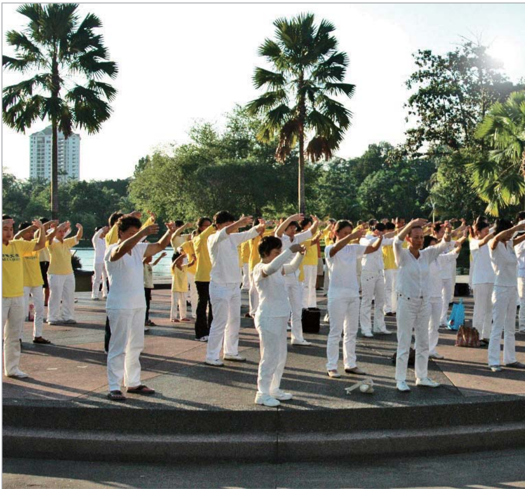
马来西亚雪隆区部分法轮功学员在八打灵再也公园集会反迫害，这是活动

1999年7月20日，中共开始了对以“真、善、忍”为修炼准则的善良的法轮功学员的残酷迫害。每年的七月，世界各地的法轮功学员都会举行呼吁制止迫害的活动，至今已经十二年。