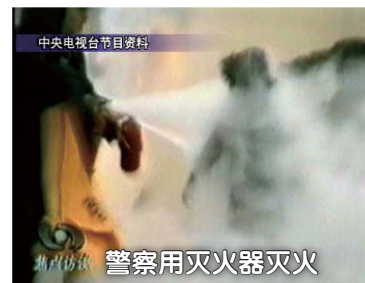
中央电视台节目资料

从央视录像得知，整个“自焚”从点火到灭火，用了一分多钟。天安门广场上并没有灭火器材，现场显示只有两辆警车，平时也不可能装备大量灭火器材。如果不是事先知情，精心策划，警察怎么可能在一分多钟内迅速拿出十几个灭火器及灭火毯？