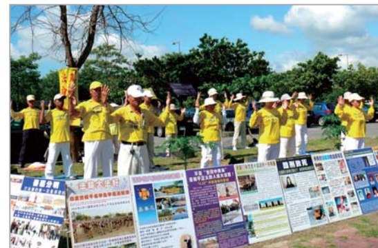
台湾东部法轮功学员集会反迫害