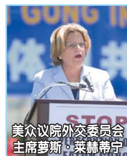
美众议院外交委员会 主席罗斯·莱赫蒂宁