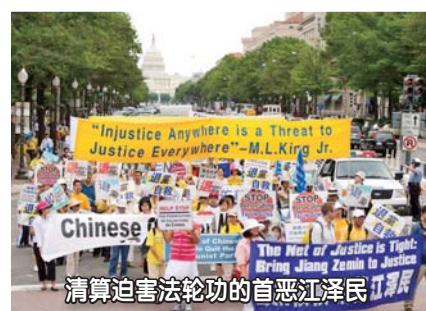
清算迫害法轮功的首恶江泽民江派