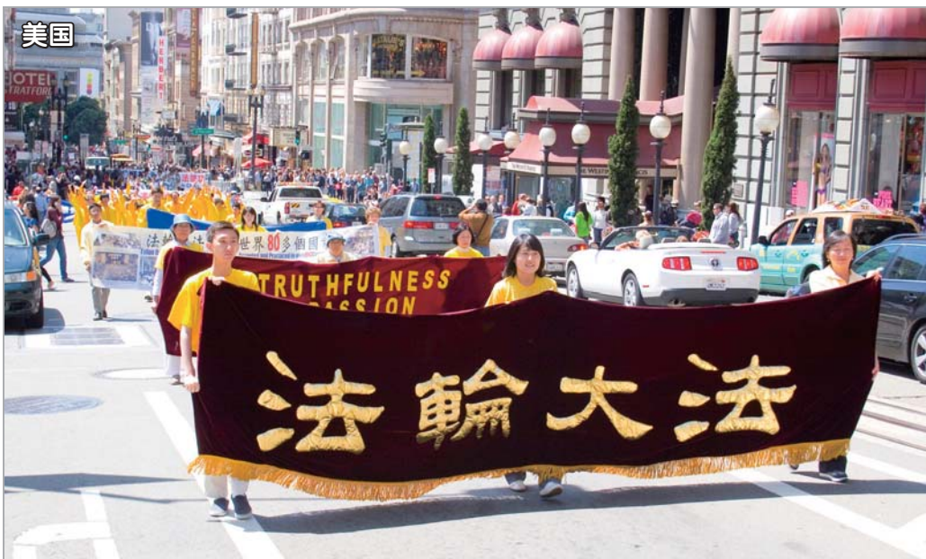
“七二零”法轮功学员反迫害十二周年，游行队伍经过美国旧金山市中心繁华商业街