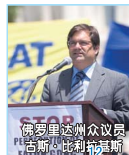
佛罗里达州众议员 古斯·比利托基斯