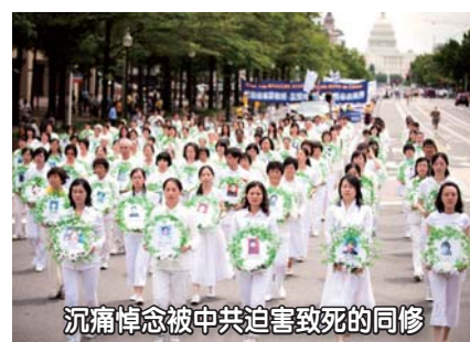
沉痛悼念被中共迫害致死的同修