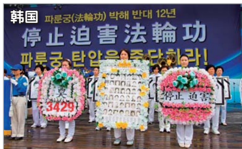
韩国法轮功学员首尔广场集会反迫害

奥维表示，法轮功赢得官司，是为本市所有的人赢得言论自由的权利。法轮功学员通过大型展板等抗议行为，告诉人们法轮功学员在中国遭到的迫害与酷刑，没有比这更恰当的方式了。