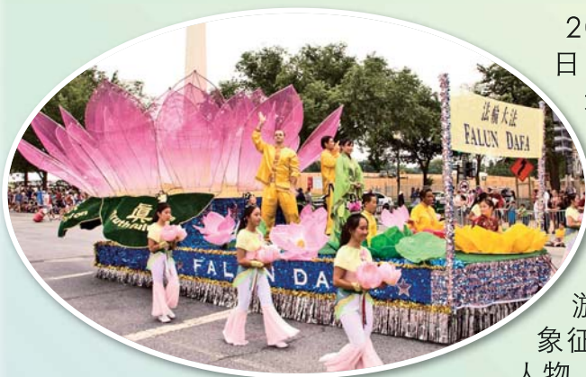
美丽的法轮功学员游行花车

2011年7月4日是美国国庆日，庆祝美国独立235周年。这一天，美国各地都举行了庆祝活动，其中尤以首都华盛顿DC举行的独立日大游行最具标志性。