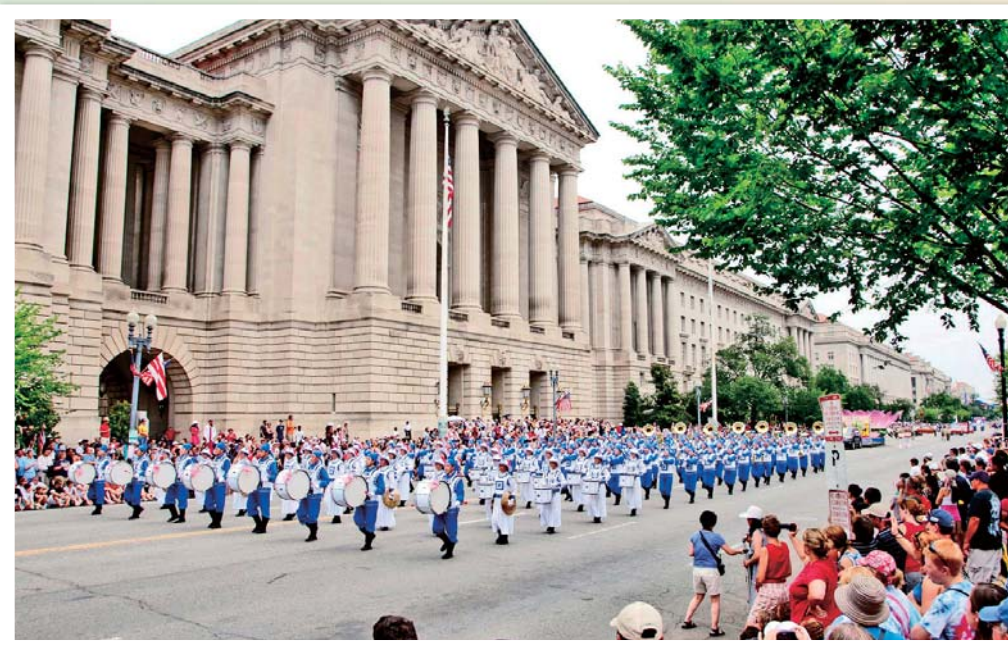
法轮功学员参加美国首都华盛顿DC举行的独立日大游行