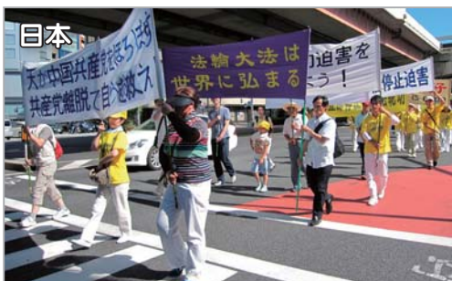
日本法轮功学员举行反迫害大游行