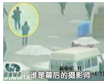
谁是幕后的摄影师

中共称：自焚录像是由安装在天安门广场的监视摄像机拍摄的。但央视录像却有大量近距离及特写镜头，这是监视摄像机做不到的。面对国际社会质疑，中共谎称这些镜头是CNN拍摄的，但CNN发言人驳斥：他们根本没拍到任何自焚镜头，因为他们的记者在自焚前就被中共控制，摄像机被没收。