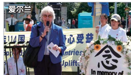
爱尔兰法轮功学员集会反迫害