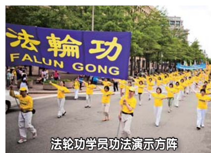
法轮功学员功法演示方阵

中午时分，美国华盛顿DC宽阔的宾夕法尼亚大道上又见“法轮大法好”、“世界需要真善忍”、“制止迫害法轮功”等法轮功真相横幅和展板汇成的长河。游行从华盛顿纪念碑开始，到法拉格特广场结束。