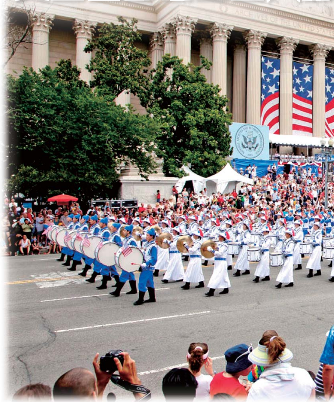
2011年7月4日，由法轮功学员组成的天国乐团