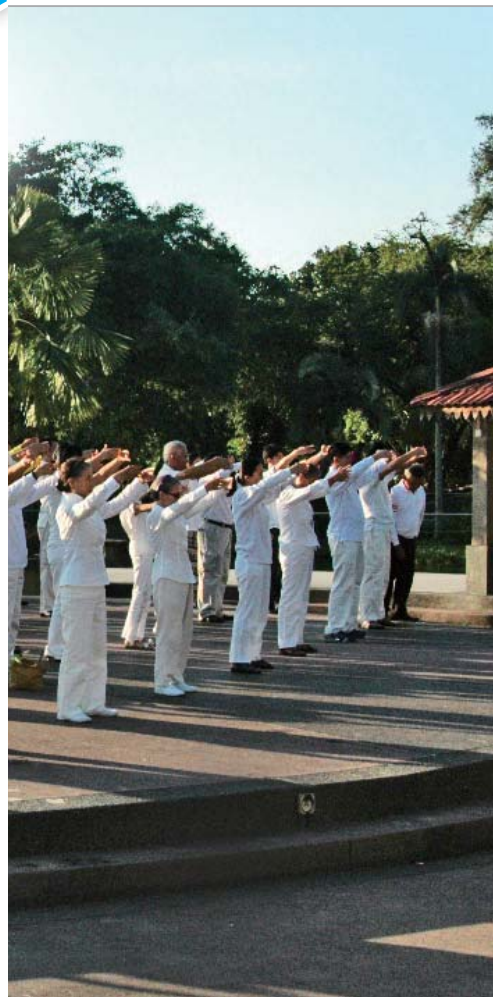
前的集体炼功场面。

4) 历史上任何一个恶棍，都没有江泽民这样利用一切接触国际媒体、国际领袖的机会直接造谣诽谤。江泽民在法国接受《费加罗报》记