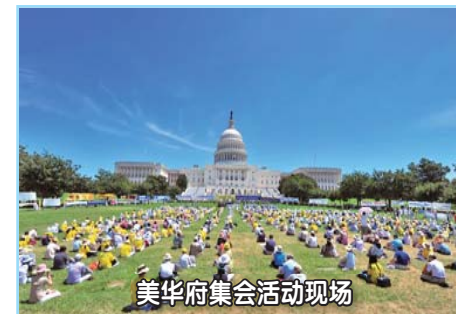
美华府集会活动现场