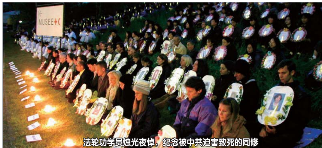
法轮功学员烛光夜悼，纪念被中共迫害致死的同修