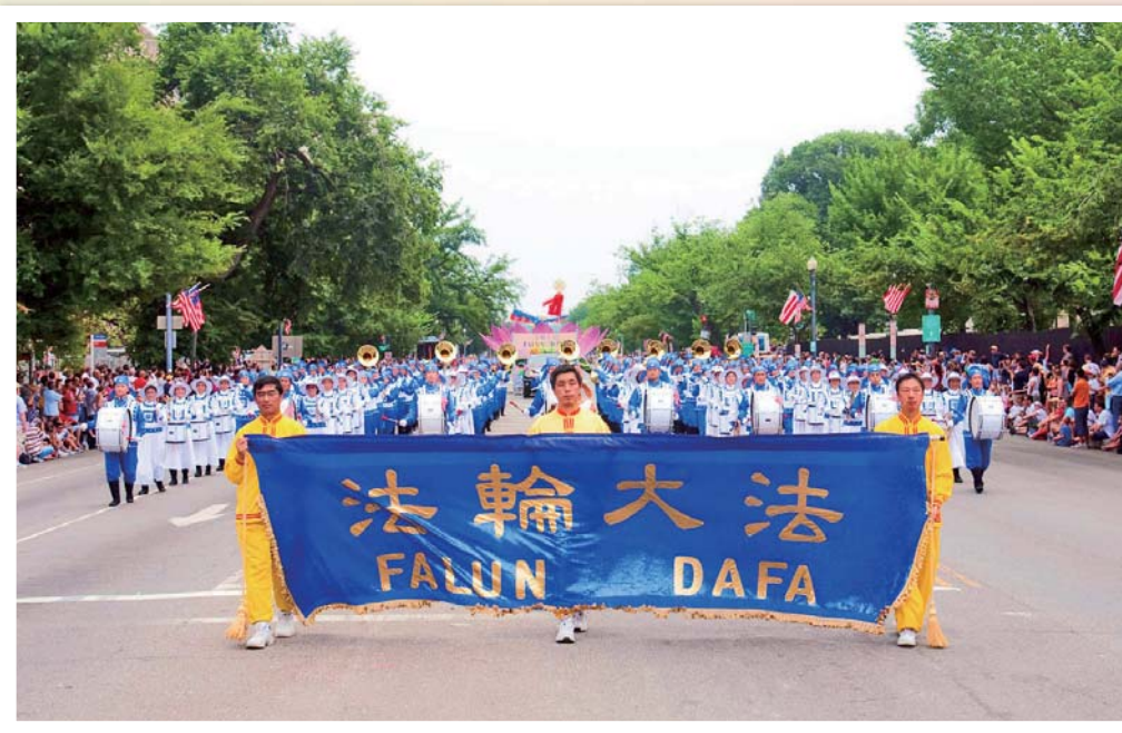
法轮功学员参加美国首都华盛顿DC举行的独立日大游行