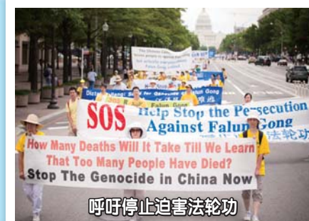
呼吁停止迫害法轮功