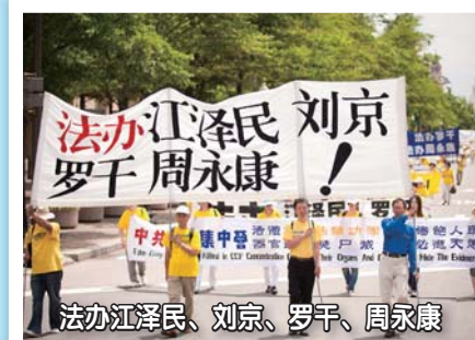
法办江泽民、刘京、罗干、周永康