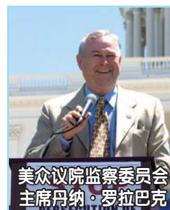
美众议院监察委员会 主席丹纳·罗拉巴克