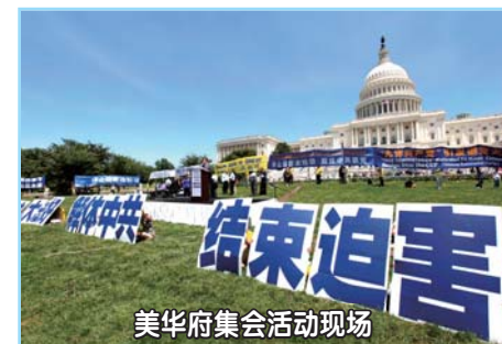
美华府集会活动现场