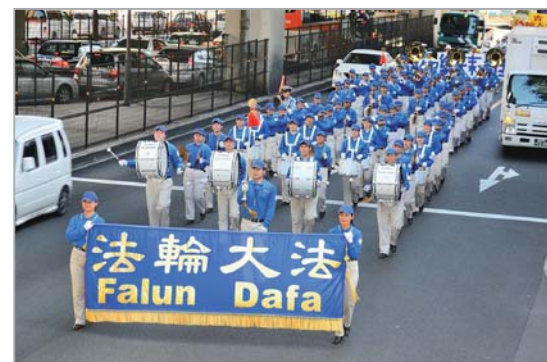
日本东京法轮功学员游行反迫害