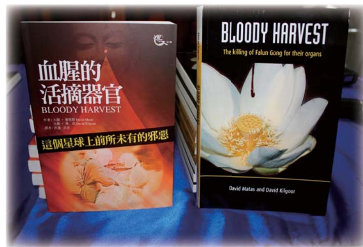
■ 《血腥的活摘器官》中文版和英文版

师协会颁发的年度人权奖，2008年1月获得了加拿大马尼托巴省律师协会颁发的2008年杰出服务奖，2008年12月30日，获加拿大总督颁发的平民最高荣誉——加拿大勋章（Order of Canada）。2010年1月16日，获国际人权协会（IGFM）颁发的2009年度人权奖。