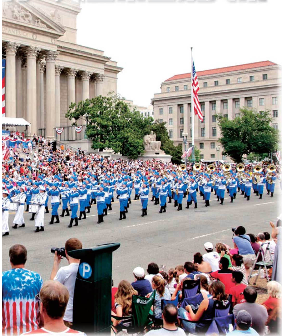
参加美国首都华盛顿DC举行的独立日大游行。