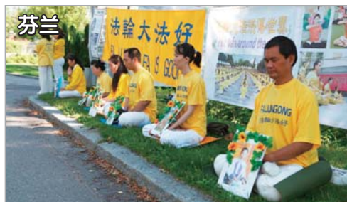
芬兰法轮功学员在中使馆前反迫害