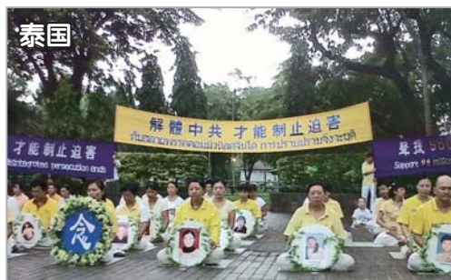
泰国法轮功学员抗议中共迫害