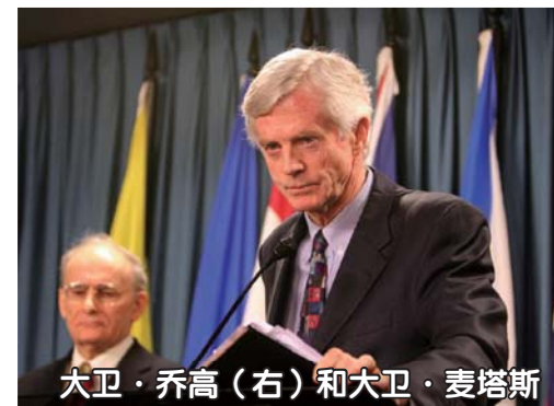
大卫·乔高（右）和大卫·麦塔斯

“中共活体摘取法轮功学员器官”被曝光后，加拿大前亚太司司长、资深国会议员大卫·乔高和国际人权律师大卫·麦塔斯组成了独立调查组，经过两个月的调查取证，向国际媒体公开了调查报告。报告认为，中国器官市场高速发展的几年中，有41,500宗移植手术的器官来源无法解释。调查结论是：“大规模的、违背意愿的对法轮功修炼者的器官掠夺一直存在，而且现在仍然在继续着。”在随后的几年中，两位人权活动家先后到过40多个国家，收集到52种中共活摘法轮功学员器官的不同证据。