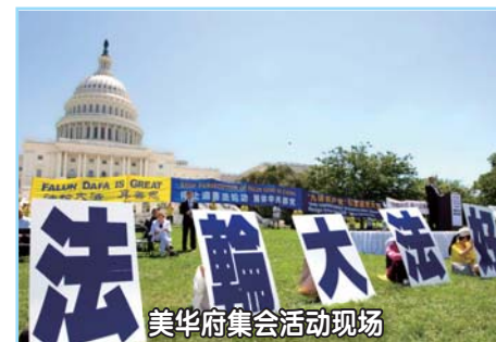
美华府集会活动现场