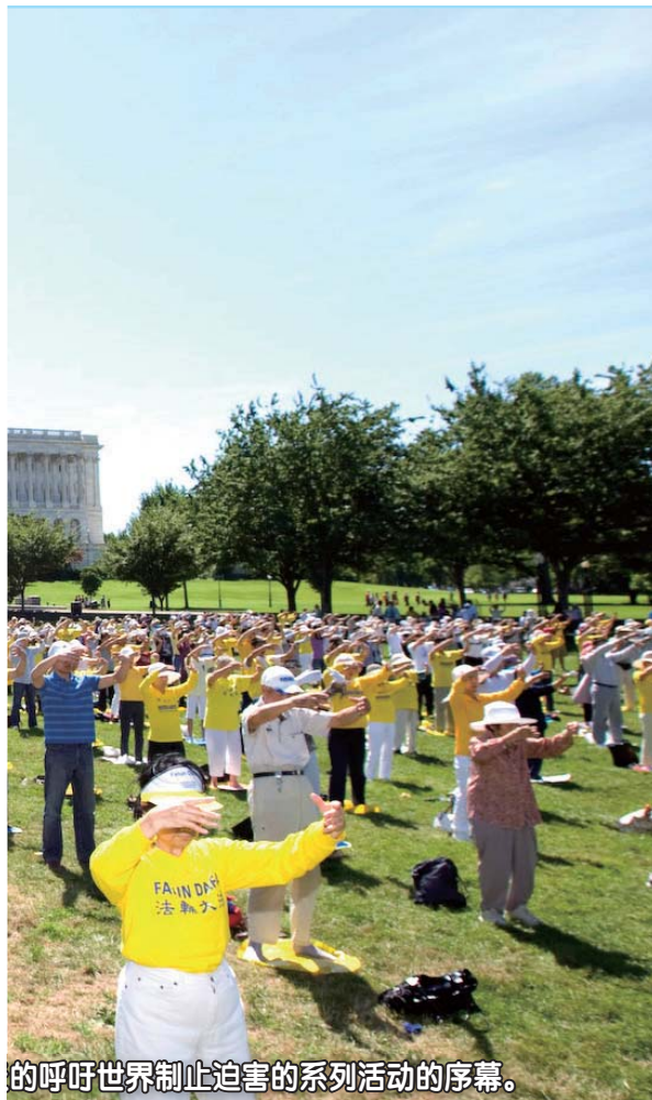
的呼吁世界制止迫害的系列活动的序幕。