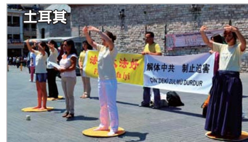
土耳其法轮功学员举行反迫害活动

在大陆严酷的形势下，12年来，法轮功学员坚持不懈地讲真相，揭露迫害，反迫害，使越来越多的人明白了真相；“法轮大法好”的横幅和法轮功真相不干胶在很多地区的大街小巷随处可见。