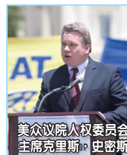
美众议院人权委员会 主席克里斯·史密斯