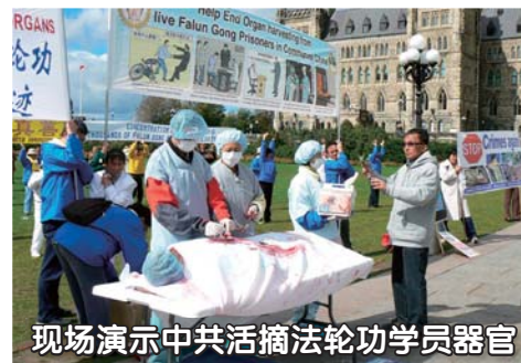
现场演示中共活摘法轮功学员器官

2009年12月12日，追查迫害法轮功国际组织公布了一位目击证人的录音证词。该证人2002年曾在辽宁省公安系统工作，参与非法抓捕、拷打法轮功学员的行动，并在活摘法轮功学员器官的罪案中担任持枪警卫。