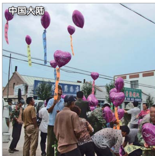
大陆民众放飞真相气球，飘带上写着“法轮大法好”等

在大陆严酷的形势下，12年来，法轮功学员坚持不懈地讲真相，揭露迫害，反迫害，使越来越多的人明白了真相；“法轮大法好”的横幅和法轮功真相不干胶在很多地区的大街小巷随处可见。