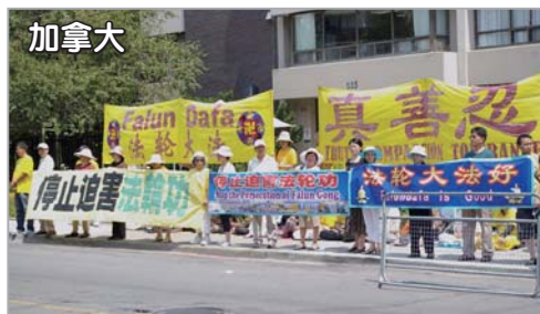
加拿大法轮功学员中领馆前反迫害