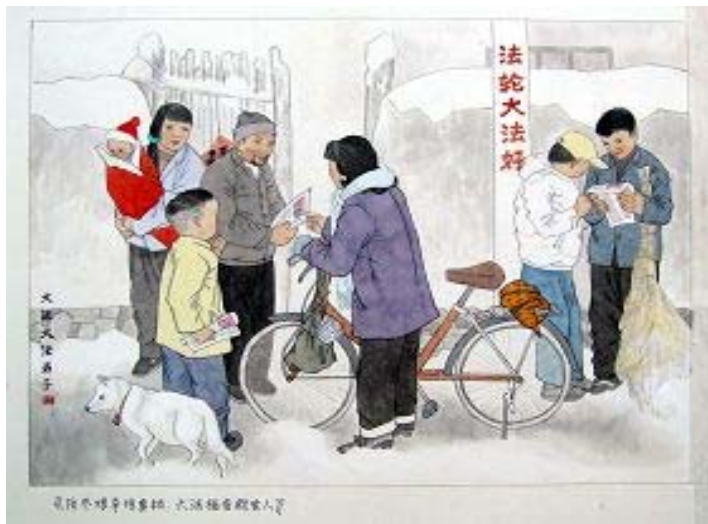
绘画: 大法福音救世人

我妹妹修炼法轮功, 她处处严格要求自己, 做事为别人着想, 和周围人相处的很好, 都说她是一个好人。妹妹