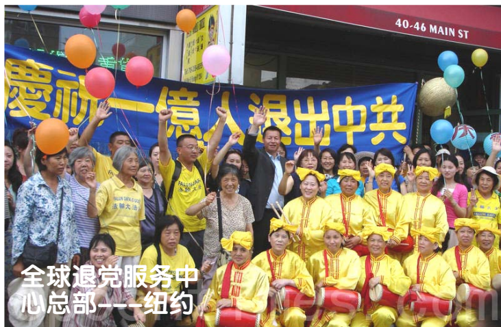
全球退党服务中心总部——纽约