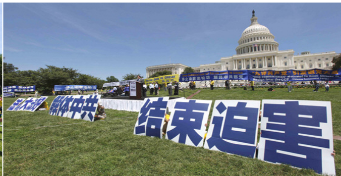
图：七月十四日早上，来自世界各地的法轮功学员汇聚在美国华府国会山，以集体炼功（左图）拉开了将持续三天的呼吁世界制止中共迫害法轮功的系列活动的序幕。

七月，世界各地的法轮功学员都会来到美国首都华盛顿 DC，在美国国会山举行呼吁制止迫害的活动，至今已经十二年。今年，二零一一年七月十四日，来自世界各地的法轮功学员再次来到美国华府的国会山，继续呼吁各界关注并制止中共对法轮功的残酷迫害。美国多位国会议员、非政府机构、自由之家、大赦国际等组织的代表纷纷到场表示声援。他们表示，美国政府应该引领世界各国，对迫害发出谴责。