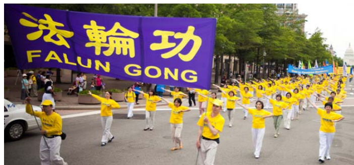
图：在二零一一年七月十五日中午，来自世界各地的二千五百名法轮功学员在美国首都华盛顿 DC 的宾夕法尼亚大道上举行盛大游行中的演示法轮功功法方阵。

以来，受各种迫害致死的法轮功学员共达三千四百三十四人。他们不是死去了，而是被杀害了。另外，为法轮功学员和其他遭受中共迫害者的权利而呼吁的人权律师们，比如高智晟，继续失踪或被关押。这些谋杀、绑架和令人震惊的侵犯人权的罪行应该停止。”