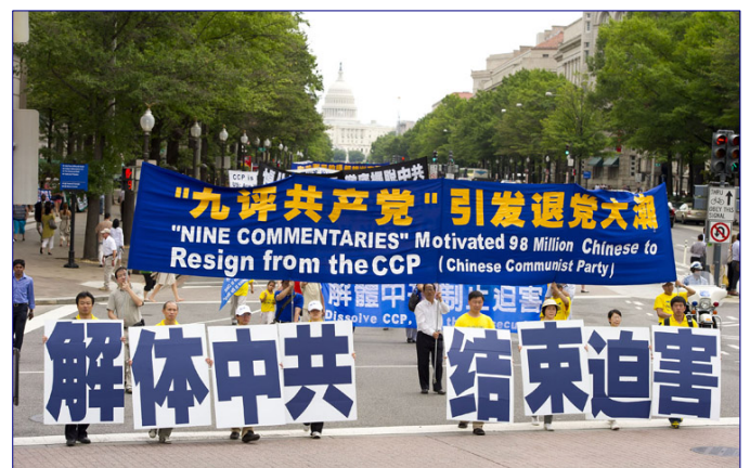
图：二零一一年七月十五日，声援三退的游行队伍在美国华盛顿 DC 的大道上行进。

位于旺角的退党点，是大陆游客必经之地。义工们每天来到这里向游客散发《九评共产党》等书籍，揭露中共十二年来迫害法轮功、残害中国民众的暴行。义工阿媚非常珍惜和游客共处的时间，她真诚地向他们解释：香港是言论自由的地方，这里所展示的资料全球都能看到，希望你们突破怕心了解到被中共封锁的真相，“今天我为了你的平安，我站在这里。你不用怕，只要你停下来，你就能