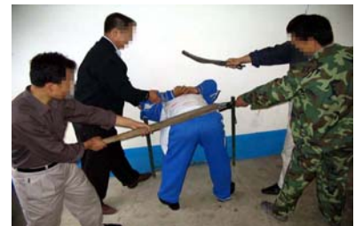
酷刑图示: 毒打, 监狱、劳教所恶警、恶人常用的残害手段。