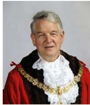
图：剑桥市长伊恩·尼莫史密斯

英国剑桥市是世界著名的剑桥大学所在地，是个人文荟萃之地，在这座城市的每一个角落都散发着浓厚的文化气息。◇