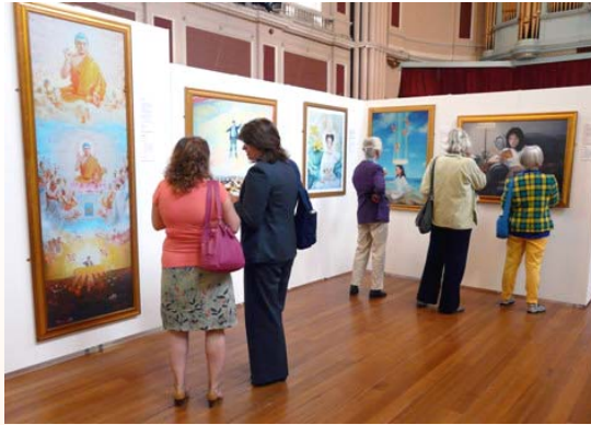
图：观众认真观看真善忍国际美展的画作 莫史密斯

市长先生在观看全部展品后再次赞叹：“我已经被画作展现的色彩和光线，以及艺术家的真诚所深深打动，艺术家们用自己真诚的感受彰显了他们信仰的普世价值。”“我希望每个人都要思考一下如何改变（法轮功被迫害）这种情况。我希望每一个人都来观看这些画作，来发现和体味平和与真理的信息体现在你自己生活里的方式。”