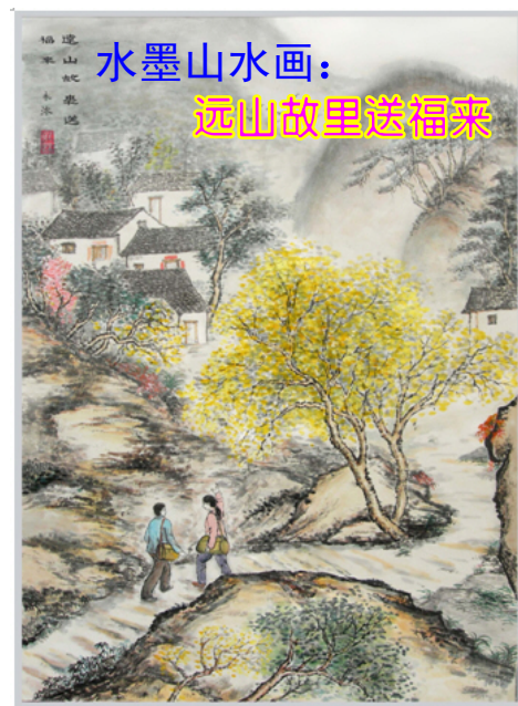
■在城市居住的大陆大法弟子把大法真相都送到了自己在农村的老家。

通过这几次有惊无险的事实，我确实确实的感受到我的生命时刻有法轮大法师父保护。我诚挚的向尊敬的大法师父叩拜，感谢李大师的救命之恩！我要告诉所有的亲友：法轮大法好！真善忍好！◇