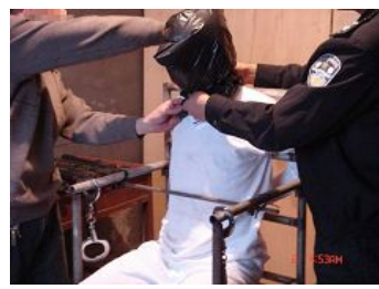
酷刑演示：用塑料袋套头，使人窒息