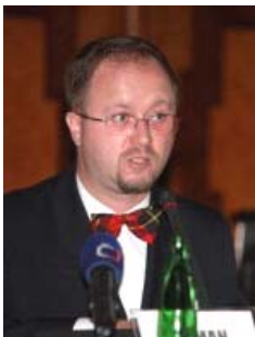
图：捷克总理的外事顾问罗曼·约赫博士

至今年八月七日一亿中国人三退（退出中共党团队）之际，捷克共和国的一些政要表示非常赞赏三退这种非暴力做法。捷克总理的外事和人权顾问罗曼·约赫博士说：“我想感谢和支持他们（参与三退的民众）的努力。中国的未来肯定属于他们，绝不属于目前的中共制度。中国有非常古老的文化，辉煌和发达的文明。几十年非自然的、不正常的中共统治不能改变中国曾拥有的辉煌历史，中国仍会有灿烂的未来，自由的中国，自由的良心，自由的信仰。”◇