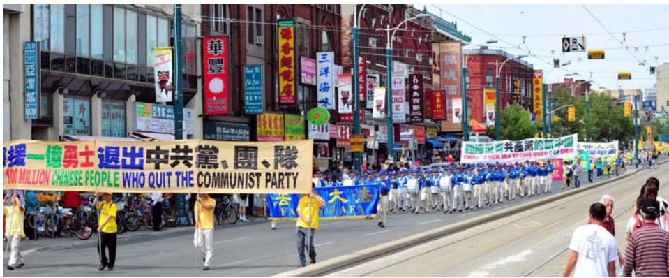
图：八月十三日，加拿大多伦多各界声援一亿中国人退出中共及其附属组织。

为什么会这样呢？因为法轮功是佛法修炼，超越了世间的任何政治、名利，中共“搞政治”的大帽子对法轮功是不灵的。历史上迫害正信的从来没有成功过。古罗马帝国皇帝火烧罗马城，嫁祸、迫害基督徒，却为自己招来了灭国惨祸。中共导演“天安门自焚”、“杀人”等闹剧诬蔑法轮功、迫害修炼人，其实是在为