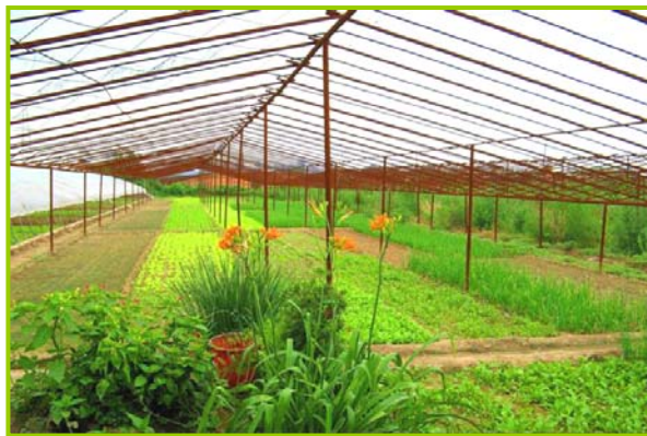
图：《神奇的田地》中，女主人的菜地和地里的平房。门上的对联依然醒目：重德扬善福禄至 正心无私泰康来。福字的顶端写着“真善忍好”。