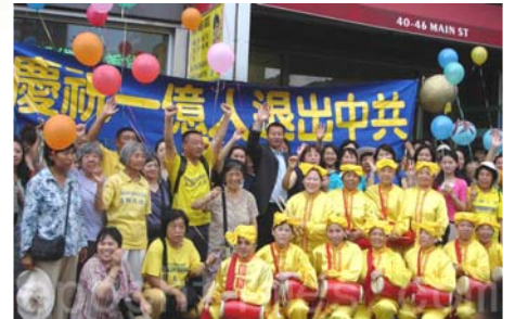
全球退党服务中心纽约总部

当初人们入党或者加入其附属组织共青团、少先队时，发誓要把生命交给这个邪灵，实际上就成了中共魔教的一员。当人们明白真相加入“退党大潮”时，就是帮助人们摆脱中共，以免成为中共被淘汰