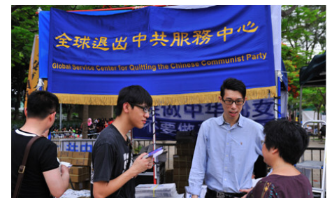
香港维多利亚公园退党服务中心