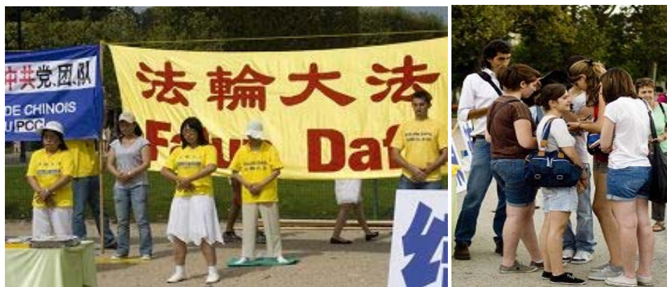
左图：法轮功学员展示功法 右图：明白真相的游客纷纷签名，支持三退。

【明慧网】二零一一年八月二十一日，来自欧洲多个国家的法轮功学员在巴黎埃菲尔铁塔前著名的战神广场上，向中西方游客揭露中共迫害法轮功的真相，并告诉人们中国现在正在发生着的巨变——已经有超过一亿中国人声明退出中共党、团、队组织，邪恶的中共正在解体中。