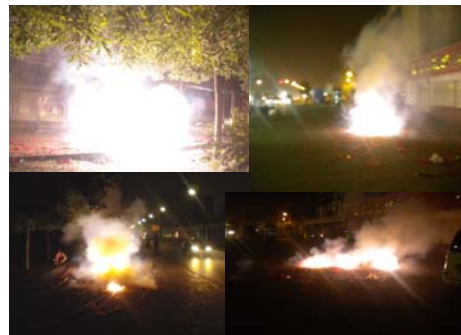
廊坊市夜晚街头正在燃放的“崩江”鞭炮。

红尘恶梦醒，世间烂鬼消。 摇摇红墙倒，三退潮更高。 声声扬正气，熠熠光正道。 今日喜相庆，未来更美好！