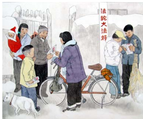
绘画：大法福音救世人

后来，他天天都到菜市场上去喊“法轮大法好”，从这边喊到那边，菜市场的人都看着他。有一天，他正喊时，一个警察用手拍他的肩膀说，你喊什么呢？他回头一看是警察，一点都没害怕，一本正经地说：“我在喊‘法轮大法好’哪！”警察问谁让你喊的？他说：“没人让我喊，这是我的人身自由，我愿意喊谁好就喊谁好，因为‘法轮大法’是天神，他能管我，让我身体越来越好。我告诉你，那真相小册子里说：共产党干那么多坏事，把法轮功学员的器官都活摘了，卖到国外去了，共产党杀好人、贪污、腐败、造假烟、假酒、毒奶粉等等，干的坏事太多了。”警察听了，转身就走了。市场上的人都说，你真行。他在街上喊了一周左右，奇迹真的出现了，病全没了。