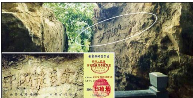
大图为“藏字石”照片，小图为风景区门票。

那个年轻的媳妇兴奋的不肯离开，要看着放炮。我不会放鞭炮，不敢点火，索性让那位先生帮忙，他接过火机，很快点燃鞭炮。然后年轻的媳妇挽起丈夫的手臂说：“咱家还有没有鞭炮了？也拿出来放一挂。崩崩这个祸害中华民族的害人精，驱驱邪。”◇