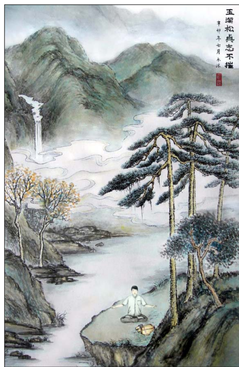
水墨山水画: 玉洁松贞志不摧