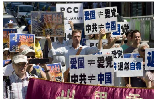
巴黎大游行，声援一亿多中国人三退