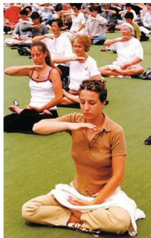
巴黎法轮功学员集体炼功

● 法轮大法弘传世界 法轮功至今已弘传一百多个国家和地区(包括台湾、香港、澳门),受到世界人民的爱戴和尊敬。李洪志先生和法轮大法因对人类身心健康做出的杰出贡献,获得各国政府各类褒奖、支持决议和信函超过3000项。法轮功书籍被译成30多种语言,在全世界出版发行,并可在互联网上免费下载。