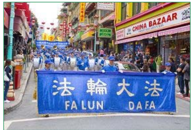
天国乐团雄壮的军乐振奋人心