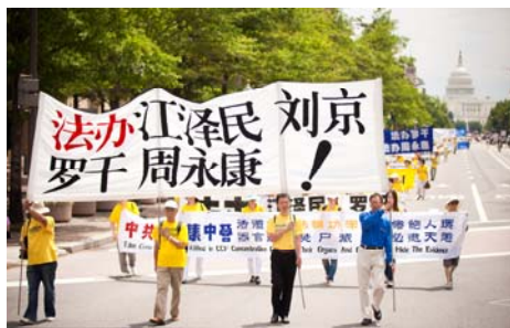
2011年7月15日，法轮功学员在美国首都华盛顿举行反迫害大游行。

2002年至今，法轮功学员在全球30个城市和地区，发起50多个控告江泽民及其他迫害元凶的诉讼，被称为21世纪最大的国际人权诉讼案。江氏集团及协从者灭绝人性地迫害法轮功学员，其手段之卑鄙，性质之恶劣，激起了全世界一切有良知的人民的强烈反对。