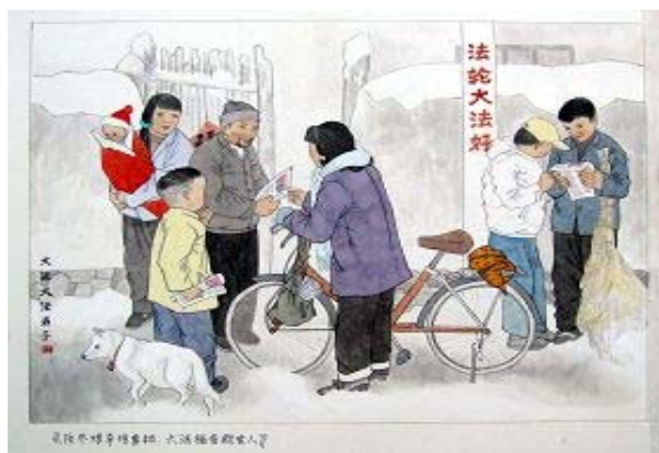
绘画: 大法福音救世人

人,占调查总人数的83.4%,通过2-3个月至2-3年不同时间的修炼,患病学员的身体状况大为改观,祛病效果十分显著,痊愈和基本康复率为77.5%。加上好转者人数20.4%,祛病健身总有效率达97.9%。(摘自中国大陆某军医大学病理教研室教授×××文稿)