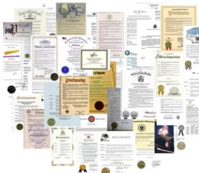
图: 2011年4月至5月,美国、加拿大多个州、市褒奖法轮大法(图为部分褒奖状)