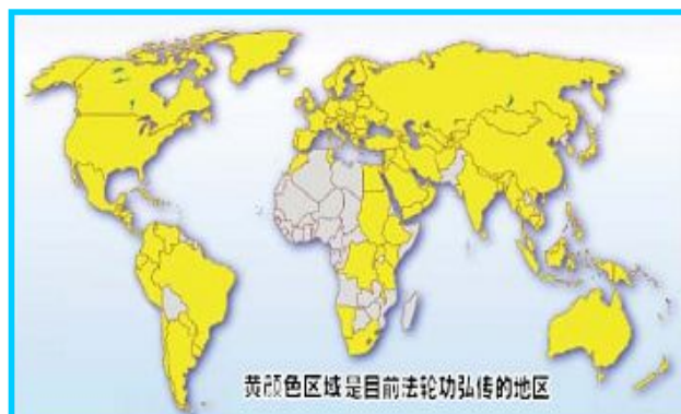
图: 黄颜色区域是目前法轮功弘传的地区